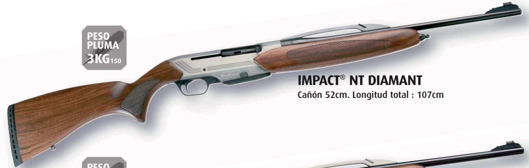
IMPACT® NT DIAMANT Cañón 52cm. Longitud total : 107cm