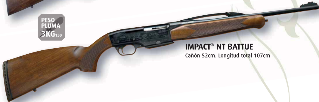
IMPACT® NT BATTUE Cañón 52cm. Longitud total 107cm