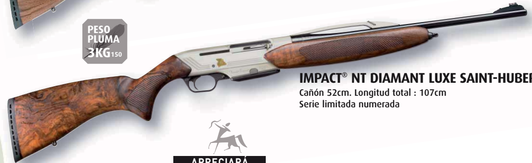
IMPACT® NT DIAMANT LUXE SAINT-HUBERT Cañón 52cm. Longitud total : 107cm Serie limitada numerada